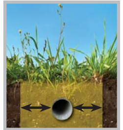
Zona de Tolerancia (haga referencia al inserto incluido con información específica de su estado)