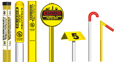
TriView™ Marker, Dome Marker, Flat Marker, Round Marker, Aerial Marker, Casing Vent Markers.