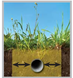
Tolerance Zone (refer to enclosed state-specific insert)

Even the most minor damage to a pipeline can have serious consequences. If you cause or witness even minor damage to a pipeline or its protective coating, do not cover up or attempt to repair the pipeline. Evacuate the area and call 911 and the pipeline company immediately.