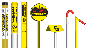
Marcador TriView™, Marcador Domo, Marcador Plano, Marcador Redondo, Marcador Aéreo, Marcadores de Tubos de Ventilación.

Los marcadores están ubicados en el derecho de paso de la línea de tuberías e indican la ubicación aproximada, pero no la profundidad, de una línea de tuberías enterrada. Aunque no siempre están presentes en ciertas áreas, estos marcadores se pueden encontrar en los cruces de ferrocarriles, las cercas y en las intersecciones de calles. Los marcadores muestran el producto que es transportado en la línea, el nombre del operador de la línea de tuberías y un número de teléfono donde puede contactar al operador en el caso de una emergencia.